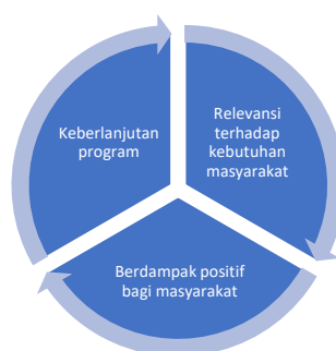
Gambar 1. Tiga Prinsip Utama PPMPM

Tiga prinsip utama PPMPM yaitu: memiliki RELEVANSI terhadap kebutuhan masyarakat, BERDAMPAK POSITIF bagi masyarakat dan memiliki prospek KEBERLANJUTAN .